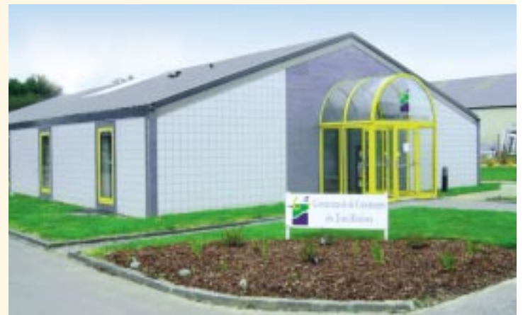
Le siège administratif de la CC3R.

Les délégués communautaires sont élus par les conseils municipaux des communes pour une durée de six ans. La durée du mandat est liée à celui du conseil municipal.